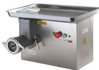
МИМ 300 М