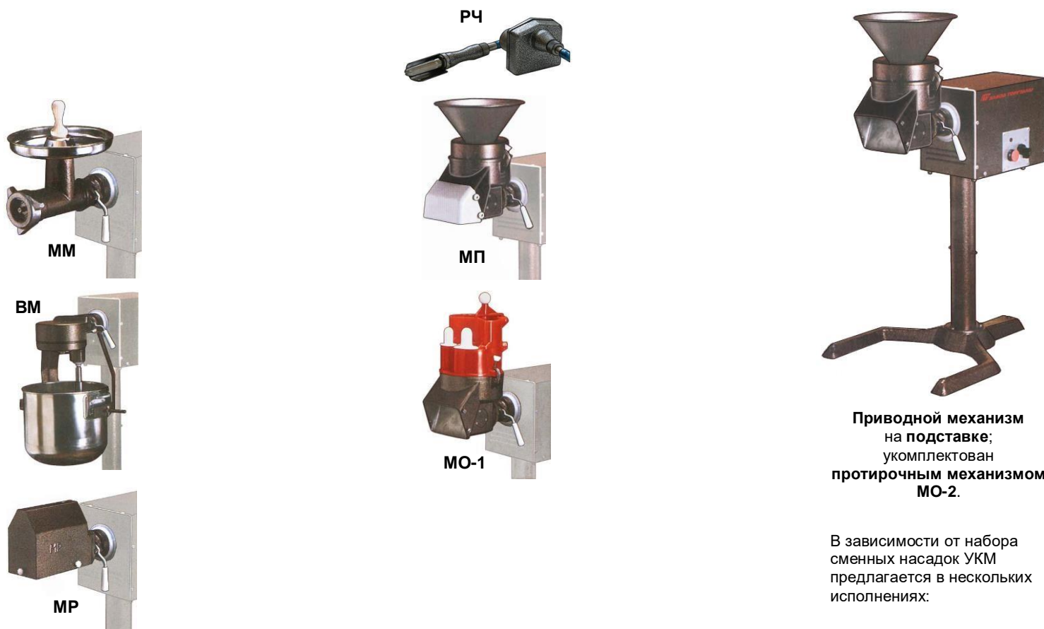
Приводной механизм на подставке; укомплектован протирочным механизмом МО-2.

УКМ состоит из приводного механизма на подставке и набора сменных насадок.